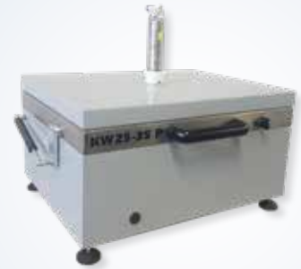
Abbildung zeigt pneumatischen Antrieb

Mit den Auswaschgeräten KW 25 x 35 und KW 25 x 35 P von Tampomark waschen Sie Ihre alkohol- oder wasserauswaschbaren Klischees gleichmäßig, bequem und sauber aus.