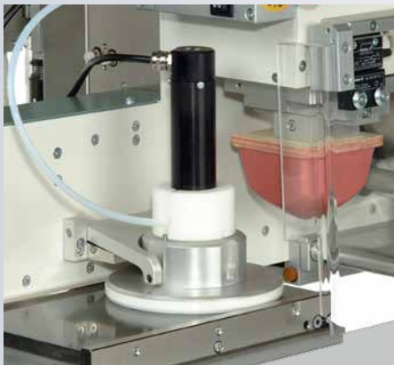
Rakeltopf mit Viscomat