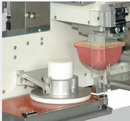
Rakeltopf ohne Viscomat