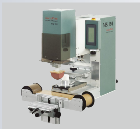
MS 150 als Tischmodell