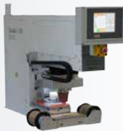
Modul 130 als Tisch-/Einbaumodell

Zur Grundausstattung gehört: Tamponreinigung, Rakeltopf, Klischeehalter, Fusschalter