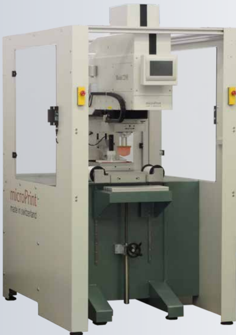
Abb. zeigt optionale Schutzumhausung