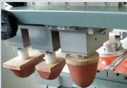
Optionale Tamponverschiebung für seitliche Tamponbewegung