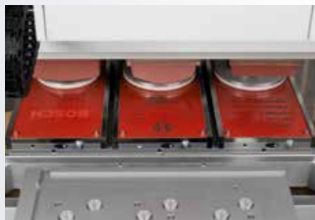
Unterschiedliche Druckbilder auf Klischee